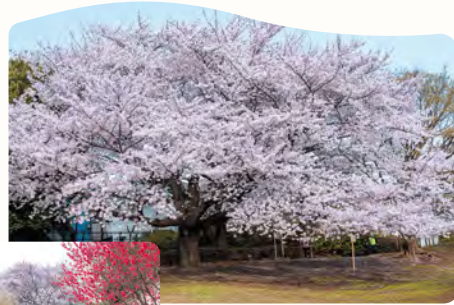
16 立野公園の桃花源 所 立野町 32-1