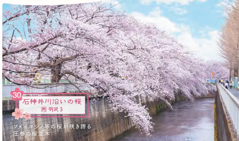
30 石神井川沿いの桜 所 羽沢3