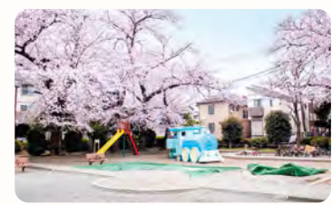
27 徳殿公園 所 豊玉南1-16-1