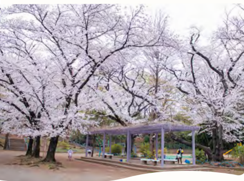
31 高稲荷公園の桜 所 桜台6-40-1