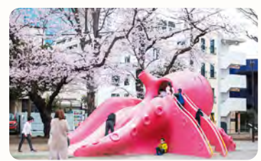
25 豊玉公園(通称:タコ公園) 所 豊玉北6-8-3