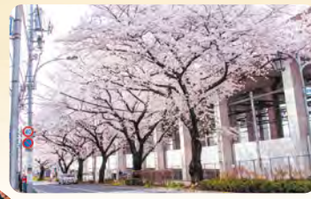
22 千川通り 所 桜台4