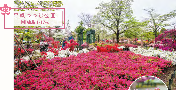
23 平成つつじ公園 所 練馬1-17-6

約600品種・約10,000株のつつじが栽培されています。1994年の開園記念で「練馬の鏡(かがみ)」と命名された久留米つつじ(右隣画像)