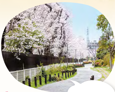
28 田柄川緑道 所 北町2~3