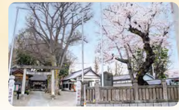
21 江古田浅間神社 所 小竹町1-59

大きなケヤキと桜の木が境内にある。重要有形民俗文化財「江古田の富士塚」が保存されています