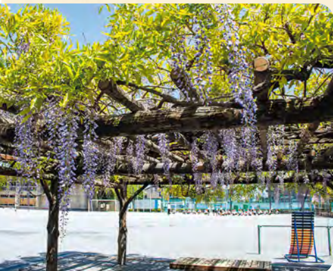
32 練馬東小学校 フジ棚 所 春日町1-30-11

栗原遺跡 城北中央公園の中にある、今から約1,300年前の奈良時代の住居跡。地方農民の生活の様子がしのばれる。