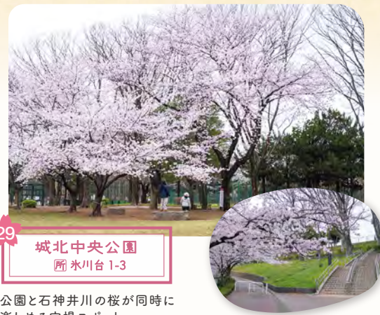
29 城北中央公園 所 水川台1-3