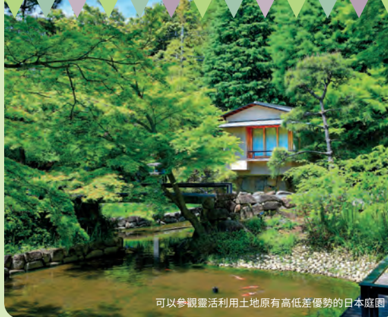
可以參觀靈活利用土地原有高低差優勢的日本庭園

豐島園街道 東京都立練馬城址公園 豐島園庭之湯 酒味義式霜淇淋專賣店 Gelateria YoiYoi THE GIANT STEP 練馬白山神社 平成杜鵑花園 練馬站