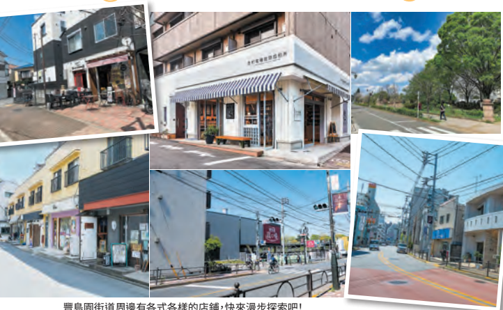
豐島園街道周邊有各式各樣的店鋪，快來漫步探索吧！